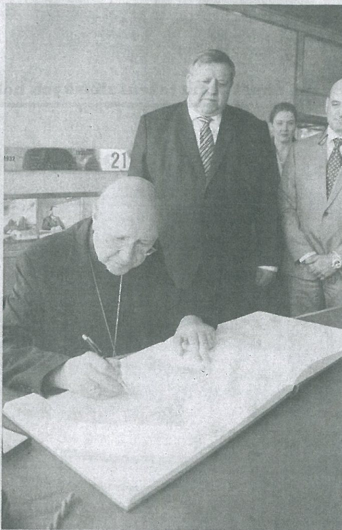
CLAUDIUS Maria Celli v pojízdné Baťově kanceláři v 21. budově ve Svítu, kde se podepisuje do pamětní knihy.

„Konečné rozhodnutí, zda papež Velehrad opravdu navštíví, zatím nepadlo. Avšak posunuli jsme se zase o krů-