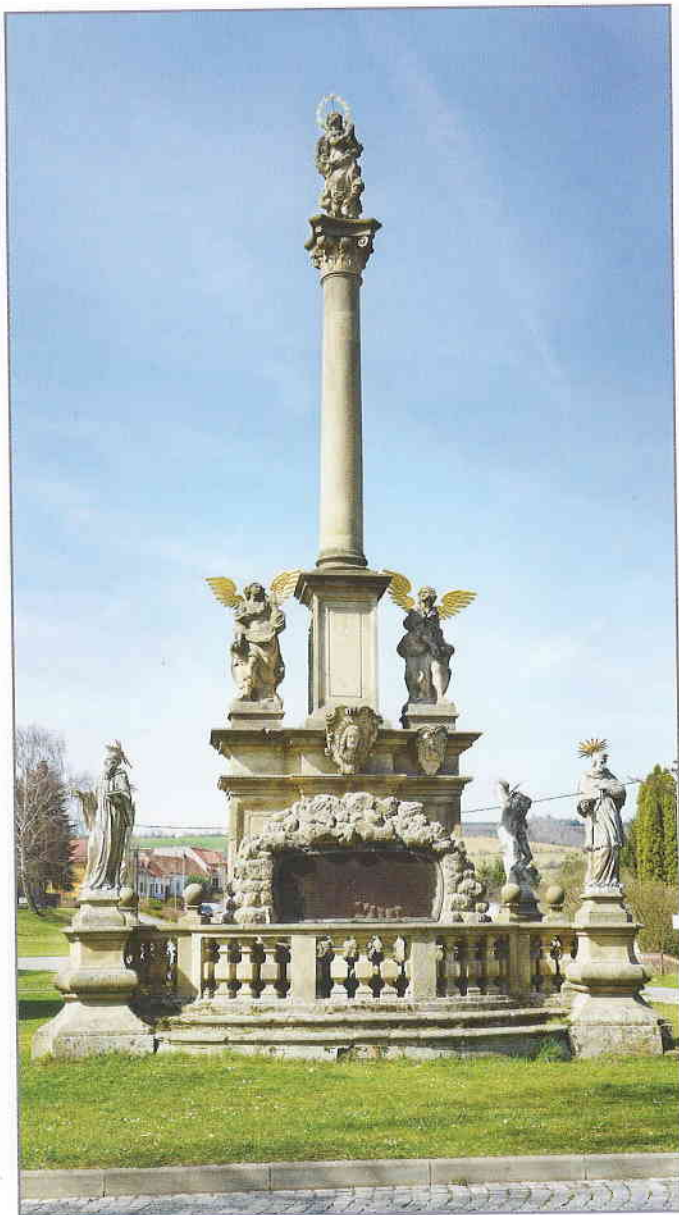
Sousoší sv. Rozálie se sloupem Panny Marie pocházející z 18. století