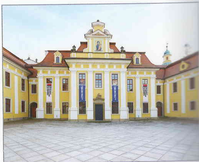
Stojanovo gymnázium Velehrad