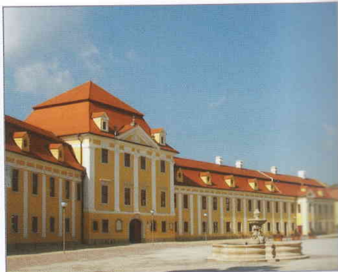
V roce 2013 byla z PRV pořízena technika pro údržbu přístupových cest a ošetření zatravněných ploch