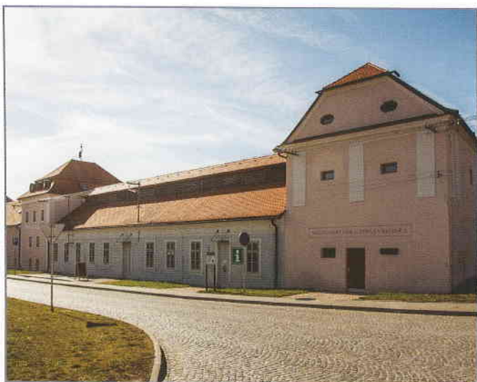
Další částí projektu byl Velehradský dům sv. Cyrila a Metoděje, který vznikl rekonstrukcí bývalé sýpky a konírny