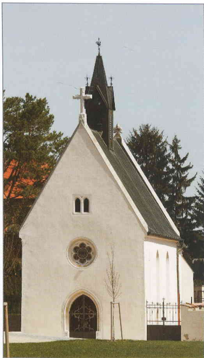
Součástí projektu byla i rekonstrukce kostela Zjevení Páně