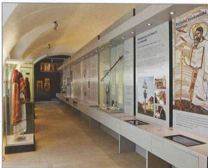
V rámci projektu Římskokatolické farnosti Velehrad došlo k vytvoření expozice s názvem Velehrad na křižovatkách evropských dějin