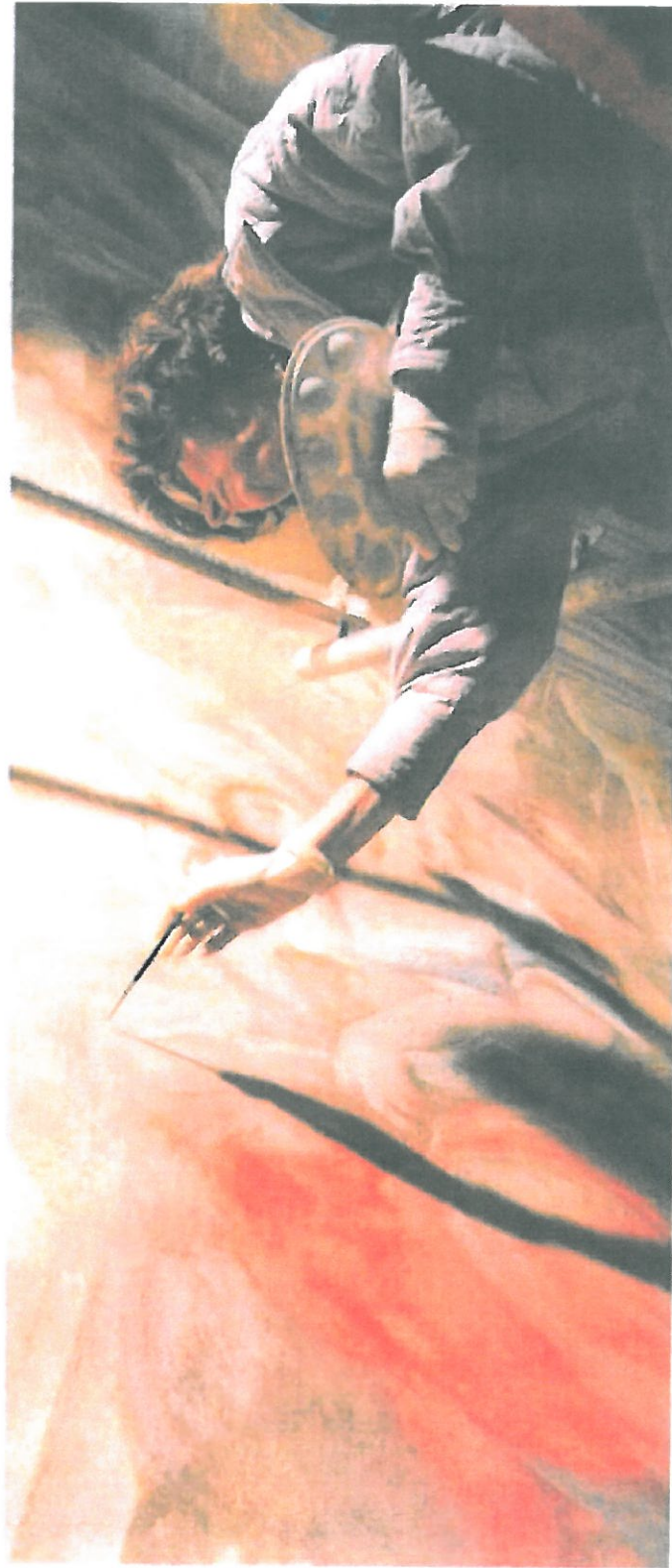
VZÁCNÉ MALBY. Restaurátorka pracuje na opravě nástropní malby v kopuli velehradské baziliky.

Jen máloletého ministra kultury Václava Radeckého tak srdečně vítali ve Velehradě, že se mu něco udělalo. Vidím monumentální dílo, které je třeba udržovat i pro příští generace," prohlásil ministr a následoval průvodcům, co všechno projekt s názvem Velehrad - centrum kulturního dialogu zapadne a bazilice uslyšel, že oprava nemůže ani vzhledem k pěti tisícům přání, přidal své doporučení. Najednou