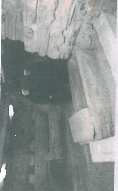
Rádové sestry procházejí lapidáriem pod bazilikou, které také věnuje rekonstrukce.