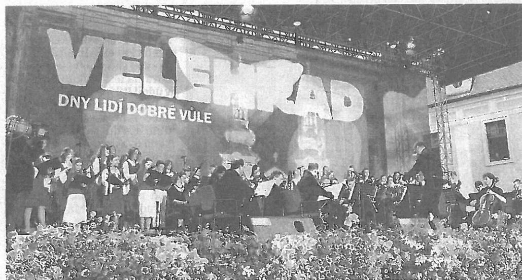
KANTILÉNA. Dětský sbor zpíval s orchestrem, Hradišťanem a doprovázel zpěváky.

„Jeho vystoupení bylo jedním z vrcholů koncertů na