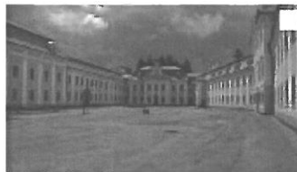
Poutní areál na Velehradě

Archeologové objevili při záchranném průzkumu při opravách areálu baziliky ve Velehradě vzácné nálezy z období vrcholného středověku. V křížové chodbě našli například unikátní dlaždici se symbolem draka, který ztělesňoval zlo a v cisterciáckém prostředí se objevuje zřídka.